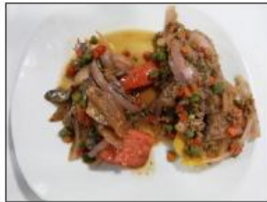
Saltado con grated de anchoveta y con lomito de anchoveta (saladita)