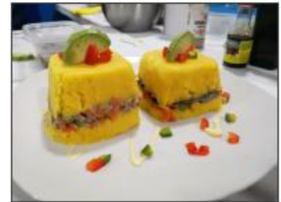
Causa con grated de anchoveta y con lomito de anchoveta (saladita)