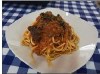
Tallarines en salsa de tomate con lomititos de anchoveta (Saladita)