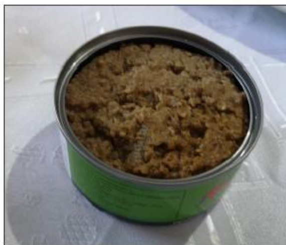
Grated de anchoveta enriquecida con minerales de la misma especie