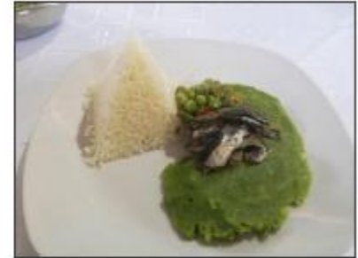
Puré de espinacas con lomititos de anchoveta (Saladita)