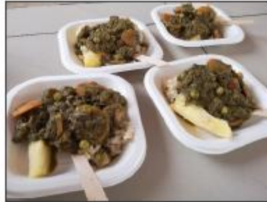
Seco con lomititos de anchoveta (Saladita)