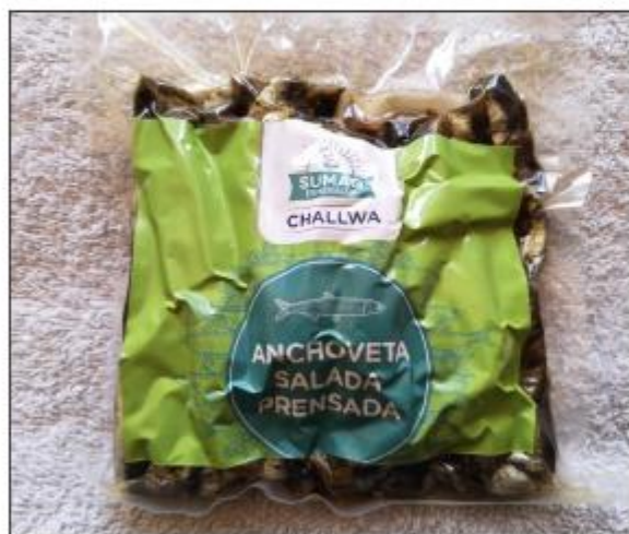
Lomitos de anchoveta salada, pensada y sellada al vacío (Saladita)

Condiciones: Ser altamente nutritivos y con perspectivas de ser sabrosos en las preparaciones