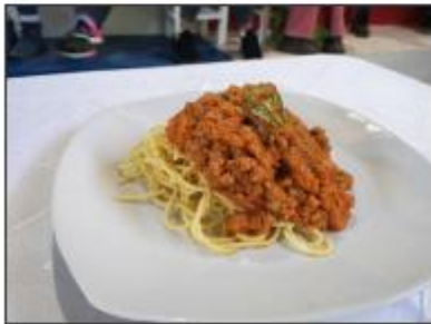
Tallarines en salsa de tomate con grated de anchoveta