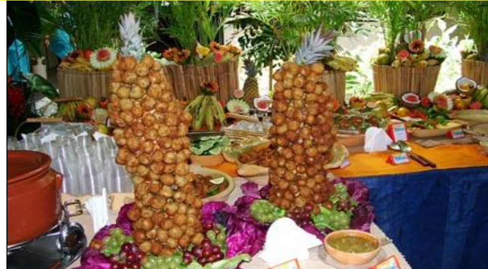
Degustación de diversos platos