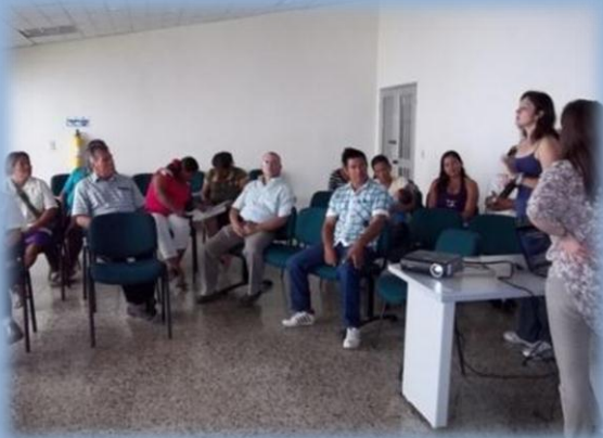
BPMP - IICA