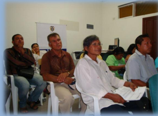
Manipulación de Alimentos