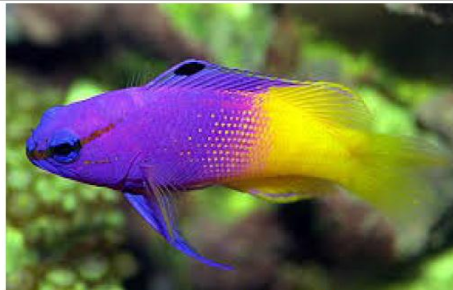
Royal gramma/ Gramma loreto