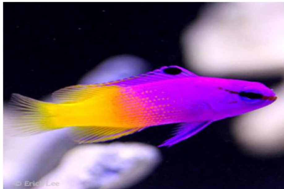
Royal gramma/ Gramma loreto